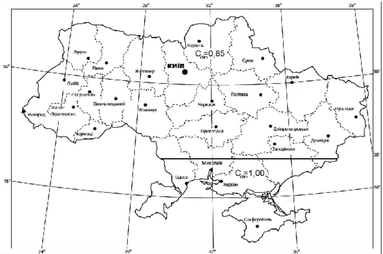
Рисунок 1 - Значення величин C_{clim}